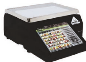
Existe en blanche